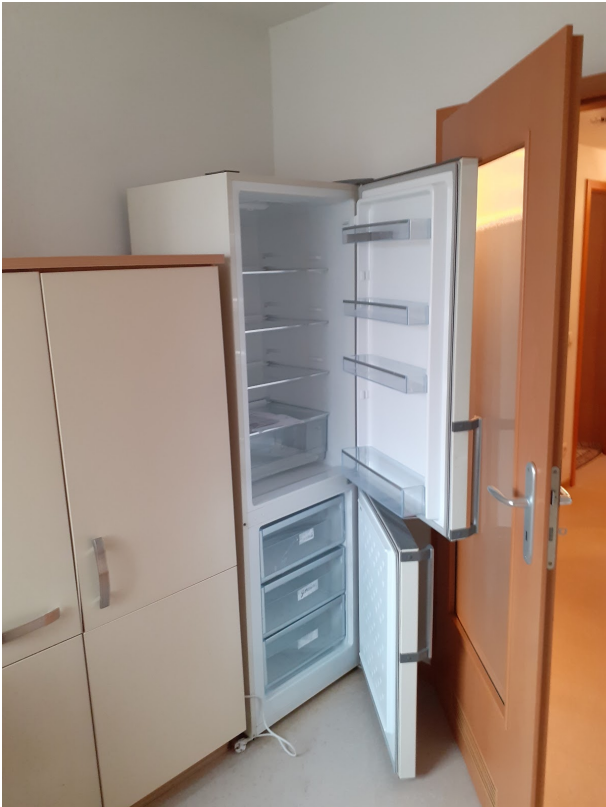
010 Küche m. Kühlschrank 20250207_140835