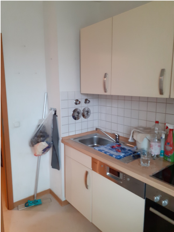
006 Küchenzeile I 20250207_140852