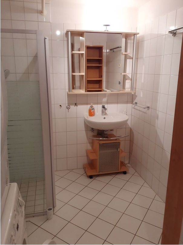
004 Bad gesamt 20250207_140656