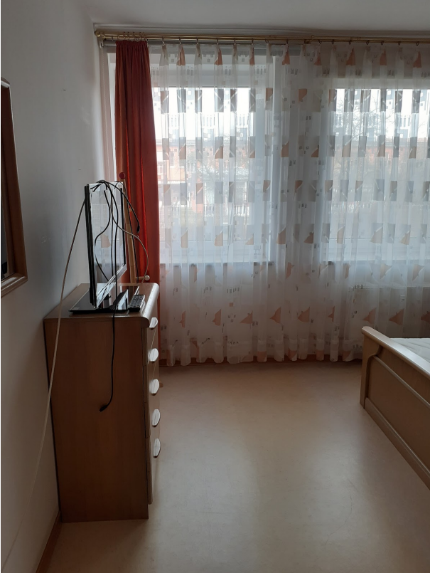
013 Schlafzimmer m. Sideboard 20250207_140715