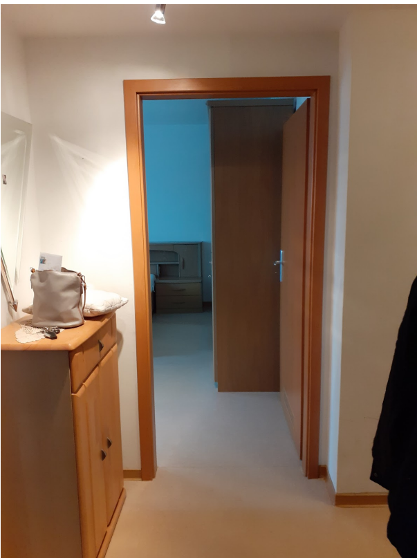
002 Diele - Schlafzimmer 20250207_140947