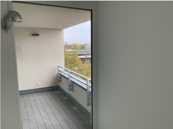
Muster Bild Loggia