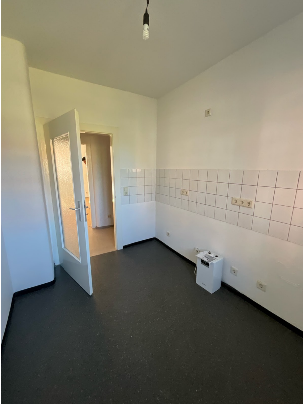
WoAb_-1101550_Bad mit WC_Bild1