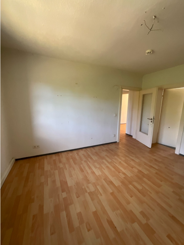
WoAb_-1111720_Wohnzimmer_Bild5 - Kopie