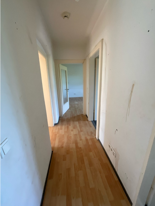
WoAb_-1111720_Vorplatz_Bild1 - Kopie