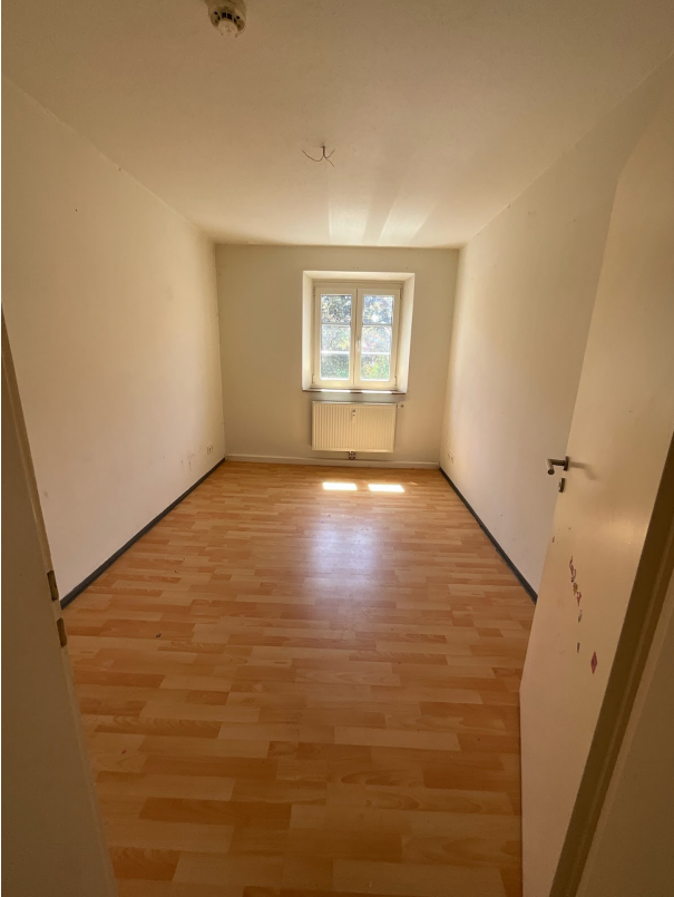
WoAb_-1111720_Zimmer I_Bild1 - Kopie