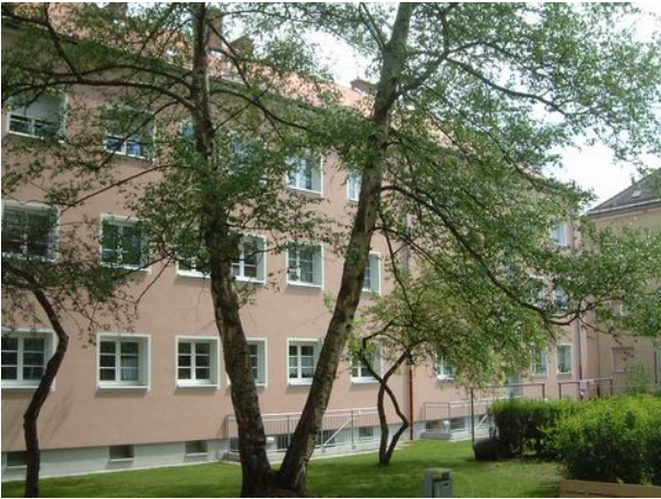
S 15 A