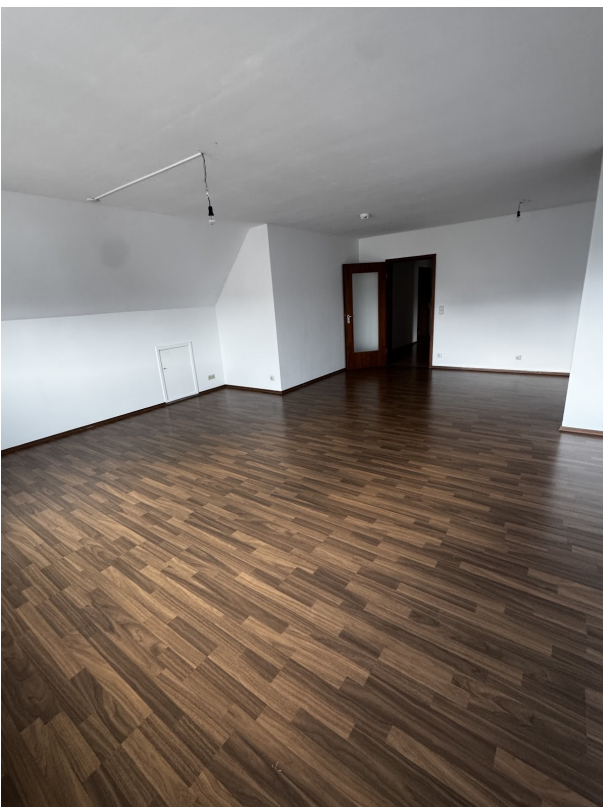
Wohn- und Esszimmer 1