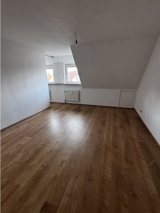
Kinderzimmer Ansicht 2