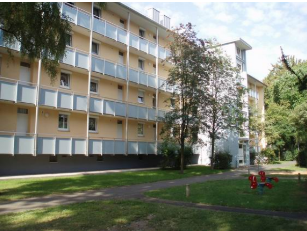
Loggia / Balkon