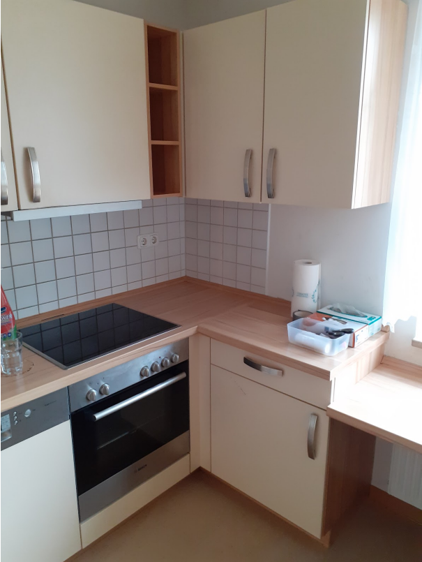
009 Küche m. Fenster 20250207_140827