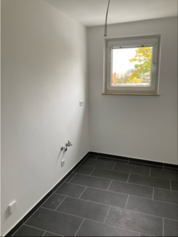
Nische im Flur