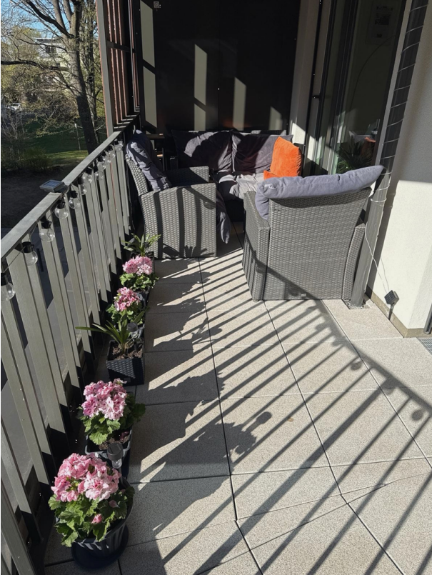
Balkon (Ansicht rechts)