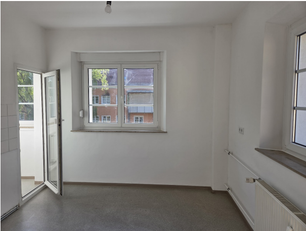
Z 11 A