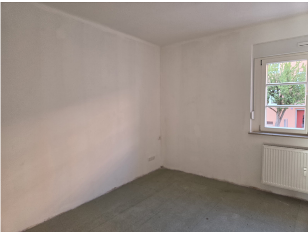
E 15 B