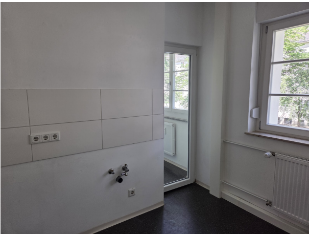
E 8 a