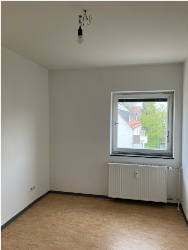
Schlafzimmer / Kinderzimmer